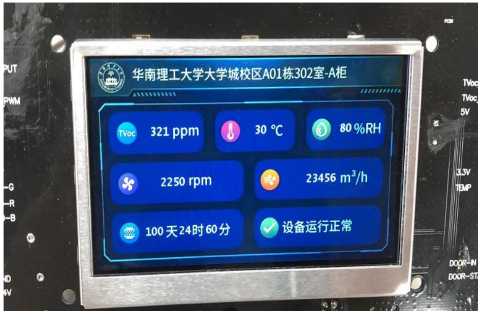
图2 实现人机交互界面产品实物图